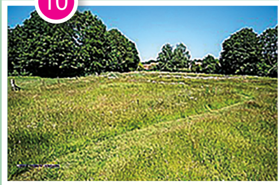
Martin Schutte De Heemen 2A, Mariënheem

De bloemenweide bevindt zich achter de voetbalvelden in Mariënheem. En naast de tennisbanen die je via de Essenbree 38 kunt bereiken en wat tevens de ingang is.