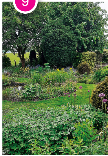
Dineke Hulstein De Havekamp 14, Luttenberg

De verrassing ligt achter het huis op een oppervlakte van 850 m 2 . Een oude tuin, waar mijn passie en rust ligt. Met (fruit-)bomen, struiken, vijvers en veel vaste planten, ook inheemse.