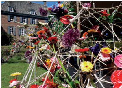
Excursie Gardenista 2019