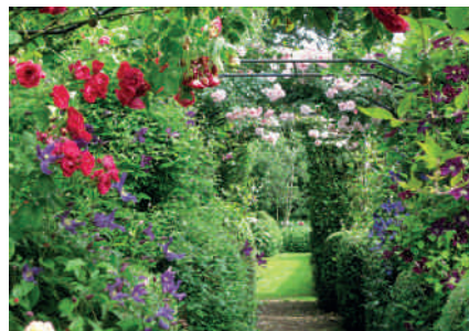
Groot Sandbrink en 't Akkerhuus

Vertrek: Vanaf de Leeren Lampe om 8.00 uur, vermoedelijke terugkeer rond 18.30 uur